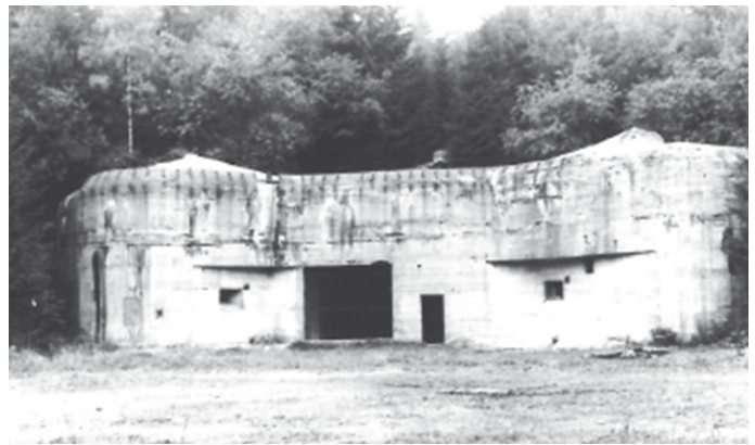
Vchodový objekt do dělostřelecké tvrze „Bouda“ K-S 22a

Samotná prohlídka tvrze začíná ve východním srubu K – S 22 a kubaturou železobetonovou (4 860 m 3 ) největším objektem tvrze. Procházka podzemím je mimořádným zážitkem. Postupně si prohlédneme prostory hlavní filtrovny, pevnostní elektrárny, rozsáhlého