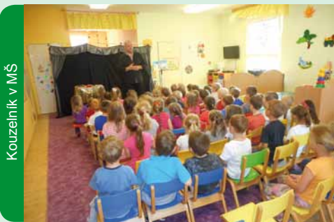
Kouzelník v MŠ