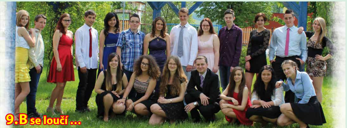
9.B se loučí...