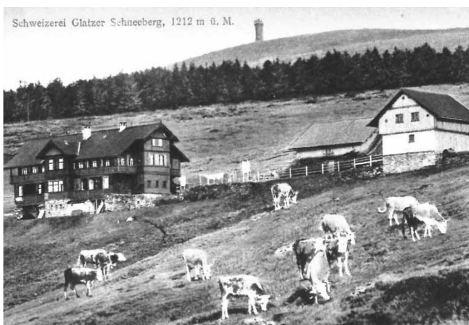
Švýcárna s hospodářskými budovami a stádem skotu. Pohled z první čtvrtiny 20. století (archiv P.Možný)