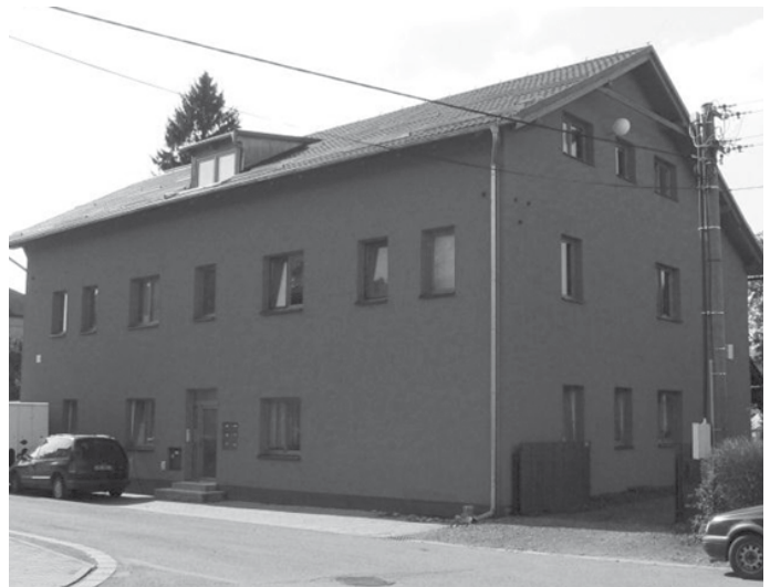
Rekonstrukce bytového domu, Družstevní ulice, Rapotín, 2013