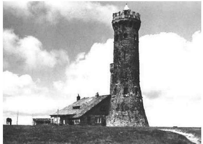
Rozhledna s hraničním kamenem vpravo