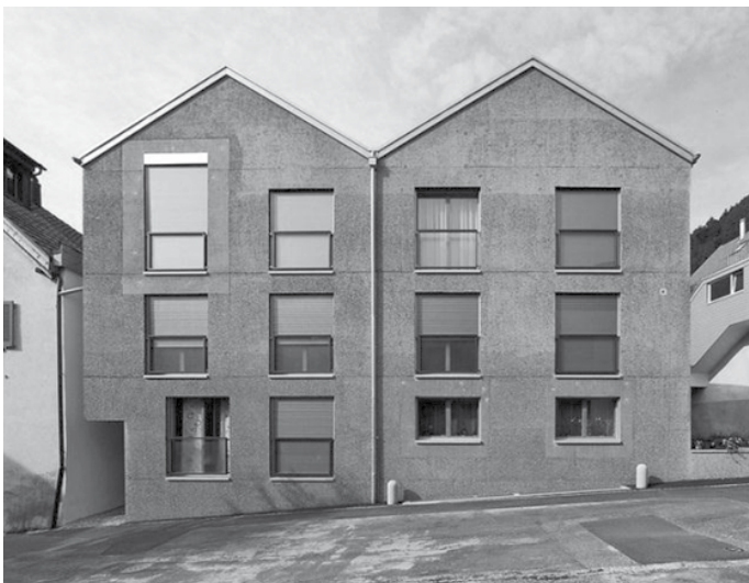
Bytový dům v centru vesnice, Haldenstein, Švýcarsko, 2008