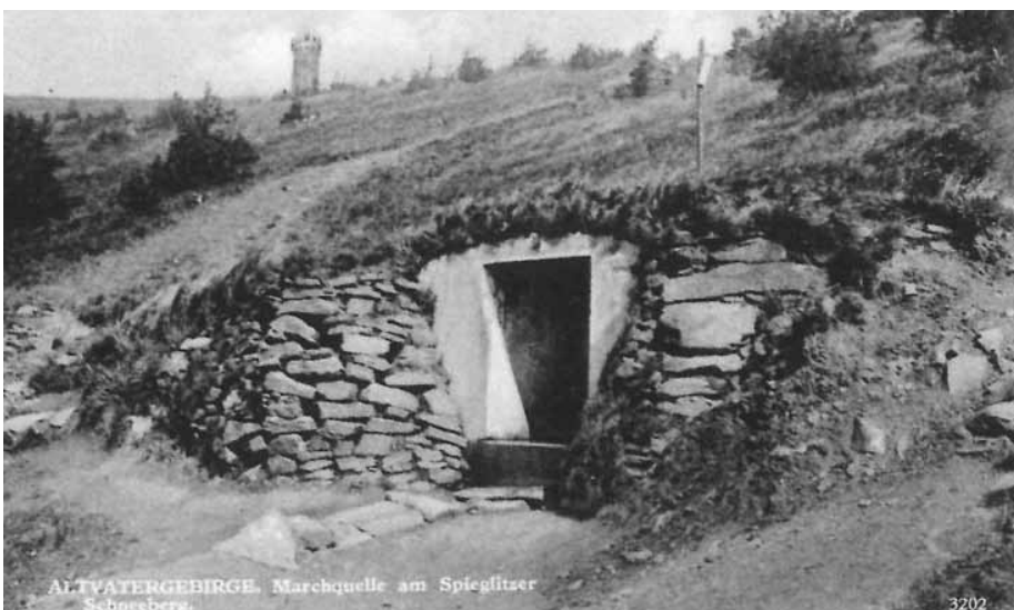
Pramen Moravy na pohlednici z doby první čs. republiky

Od roku 1990 se pořádá na podzim „Pochod k prameni Moravy“.