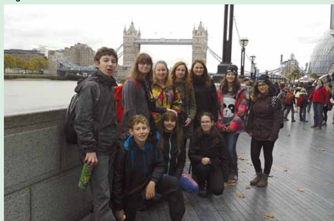
Londýn - The Tower Bridge.