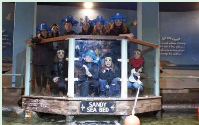
Brighton - The Sea Life Center.