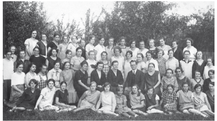
Tkadleny z tkalcovny Frank Lane.

Nejznámějším objektem Krenišova je zdejší vrchnostenský dvůr. Zde byl 26. října 2010 slavnostně zahájen provoz Muzea silnic. V nejcennějším křídle dvora byla nainstalována stálá muzejní expozice věnovaná historii cest a silnic, práci cestářů a silničářů. Dále je zde stálá expozice – Po stopách bratří Kleinů, dále – Silniční mosty – historie a současnost, již zmíněná stálá expozice „Via est vita“ – silnice je život a mnohé příležitostně výstavy. Toto muzeum je na celé severozápadní Moravě zcela ojedinelé.