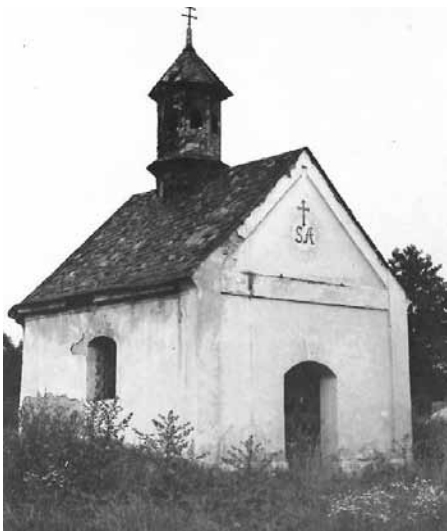
Kaple v krenišovském dvoře r.1964

K většímu, pravobřežnímu dílu patří části nazývané Za staveními a Ostrov. Menší, levobřežní díl se nazýval Luže a táhl se za mostem přes Desnou. Malé historické jádro Krenišova leželo na Ostrově. Z prostoru mezi tokem Desné, mlýnským náhonem a odpadem náležela vsi západní část. V jejím jižním cípu pak byly soustředěny významné stavby: panský dvůr (dnes Muzeum silnic), mlýn, kaple a hostinec. Ten byl podivně umístěn nad mlýnským odpadem, takže suterénem protékala voda. Zákrut koryta Desné, asi 200 metrů pod krenišovským mostem, se likvidoval v roce 1871 po povodni, kdy došlo k napřímení toku. Tím přestala existovat viditelná katastrální hranice. V témže roku přešla levobřežní území Sobotínská dráha a v roce 1873 také moravská pohraniční dráha. Budovy mlýna se dostavovaly naposledy v roce 1895. Po zřízení turbíny v roce 1916