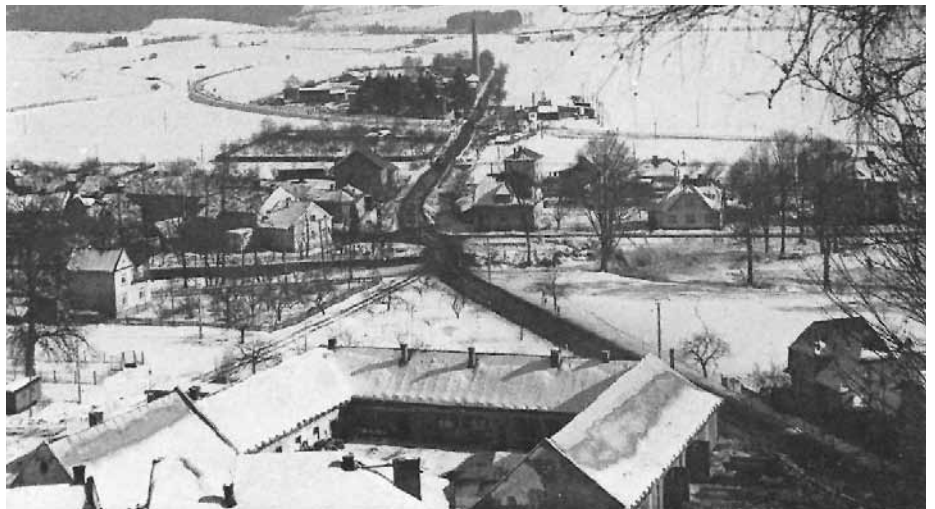
Krenišovský dvůr r.1964 (archiv S.Hošek).

se zde vyráběl elektrický proud, využívaný v okolí. Po roce 1945 mlýn dál sloužil svému účelu a mnozí rolníci z Rapotína jej hojně využívali (asi do roku 1955).