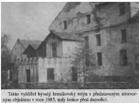
Takto vyhlížel bývalý krenišovský mlýn s představeným silotvorným objektem v roce 1985, tedy krátce před demolicí.