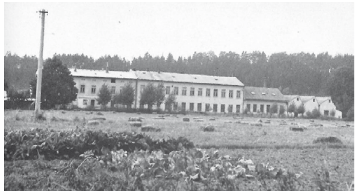
Tkalcovna Inu Frank Lane.