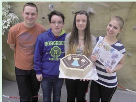
Třída 9.B ZŠ Petrov n/D