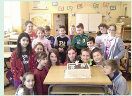
Třída 3.C ZŠ Sobotín