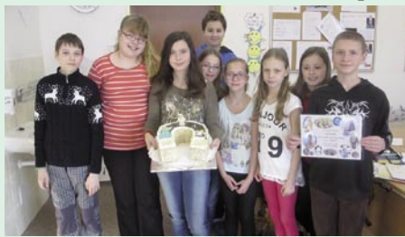
Třída 5.B ZŠ Rapotín