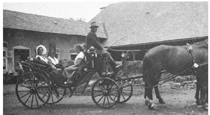
Poslední rapotínská rychtářka