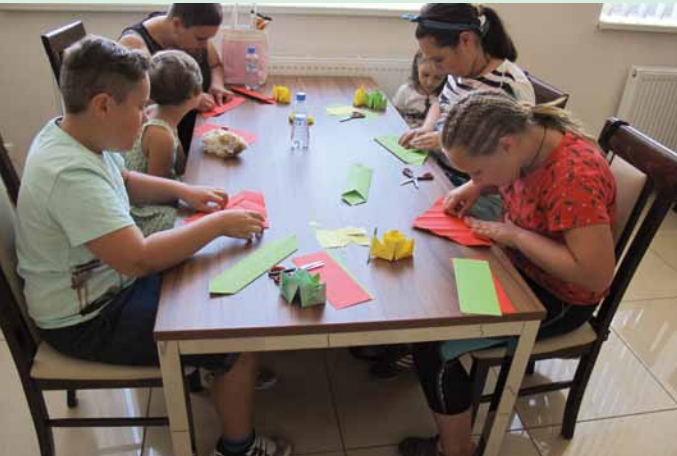
Dílnička – origami