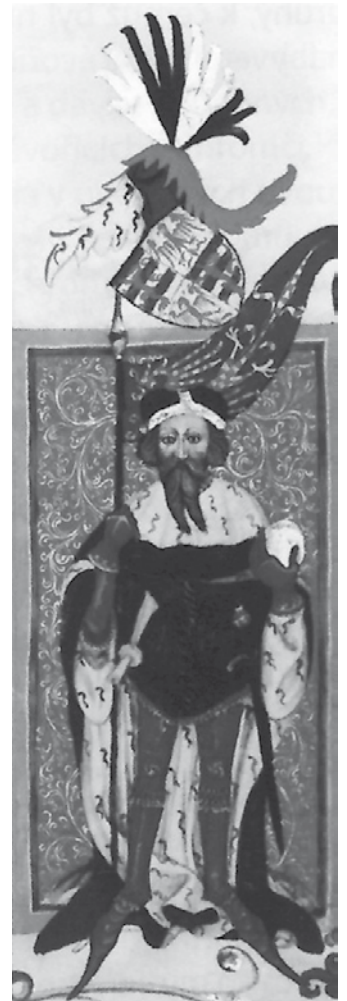
Jošt Lucemburský, markrabě moravský