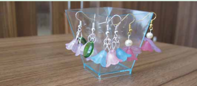
Dílnička – květinové šperky