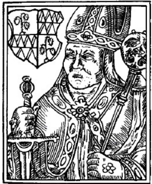
Bischof Bruno von Schaumburg

① Odúmrť – je jmění zůstavitele, jenž neměl žádné dědice ze zákona ani ze závěti. Prakticky tedy majetek každého, kdo zemřel bez mužských dědiců, připadl panovníkovi (resp. vrchnosti v případě poddanských statků). Odúmrť (též právo mrtvé ruky) byla velmi nepříjemnou záležitostí, protože tak rod (či rodina) mohl přijít o majetek budovaný pracně po několika generacích. Proto v praxi existovaly různé snahy, jak odúmrť obejít (např. rodinný nedíl) nebo právo na odúmrť od vrchnosti (panovníka) odkoupit. V některých městech nebo i jejich okolí existovalo i dědičné právo žen (např. Cheb, Zatec). Od 14. století se vrchnost začala tohoto práva vzdávat, a to hlavně proto, aby zabránila vzniku pustnoucích míst. Český panovník se odúmrtního práva vzdal vůči šlechtickým majetkům v roce 1497 pro Čechy (Vladislav II. 1471-1516) a v roce 1587 pro Moravu (Rudolf II. 1576-1611). Na některých panstvích se tato praxe udržela až do doby josefínské.