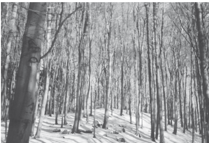
Místo bývalého hrádku na Strážníku