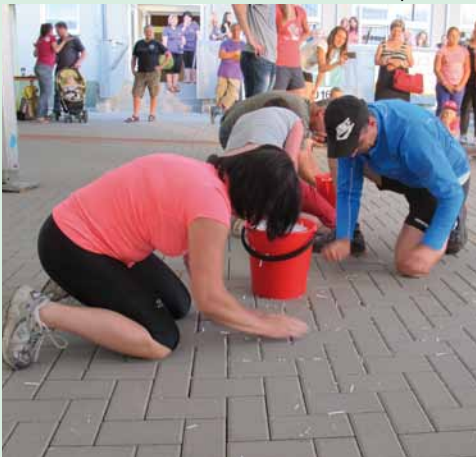
Soutěž v úklidu