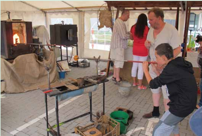
Mobilní sklářská pec