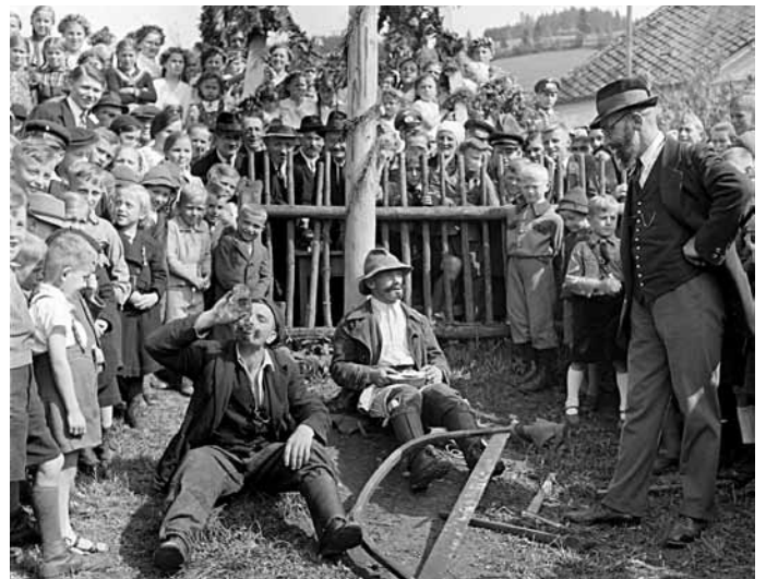
Vernířovice r. 1939.

Jistou variantou stavění májky bylo zatlukání sloupku. Sloupek byl postaven na dobře viditelném místě před okny milované dívky. Tato skutečnost znamenala pro dívku veliké vyznamenání. Musela však ještě před rozedněním sloupek uříznout a přitom ji nesměl nikdo z vesnice spatřit. Když se jí to podařilo, věřila dívka, že láska toho, kdo sloupek do země zatlukl, bude stejně pevná, jako ten vši silou do země zatlučený kůl.