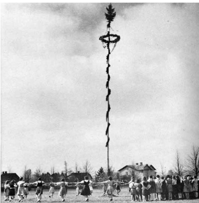
Májka v Rapotíně r. 1938.