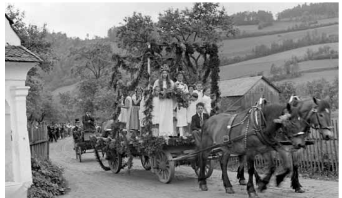
Vernířovice r. 1939.

ještě před sto lety. Za čarodějnic se považovala kovářka, protože měla pozoruhodné vzezření, pohyby a zvláštní způsoby. Proto musela, když se v teplejším ročním období chodilo na boso, mít mezi prsty u nohou nějaké stéblo trávy nebo slámy či kořeni. Když přišla do nějakého domu, nenechali jí za žádných okolností vejít do stáje, aby neočarovala dobytek.