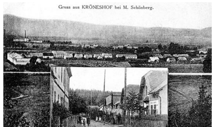
Gruss aus KRÖNESHOF bei M. Schönberg.

K většímu pravobřežnímu dílu patřily části nazývané Za staveními a Ostrov. Menší levobřežní díl se nazýval Luže a táhl se za mostem přes Desnou směrem k dnešnímu letišti a rekreační části Krásné (dříve Šentál). Už zmíněné historické jádro vsi leželo na Ostrově a vlastní zástavba ležela severozápadně. Charakter bývalé obce, jež bývala klidné až odpočinkové místo, narušila stavba silničního obchvatu. Tehdy bylo přemístěno i koryto původního Holubího potoka, do kterého původně ústil mlýnský náhon. Potok byl tehdy napřímen, tekla nikoli jižně, ale východně od Rapotína. V roce 1991 bylo nové koryto Holubího potoka ustanoveno jako jižní hranice rapotínského katastru. Původní historická hranice mezi obcemi nebyla akceptována a Rapotín přišel o malou část pozemku, ovšem pro občany, bydlící pod Holubím vrchem, dost významnou.