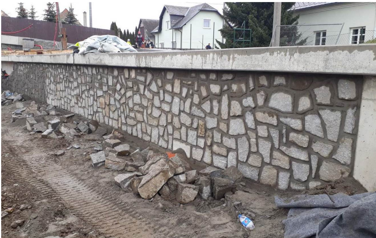
Obrázek 5: kamenné obklady na SO38.3