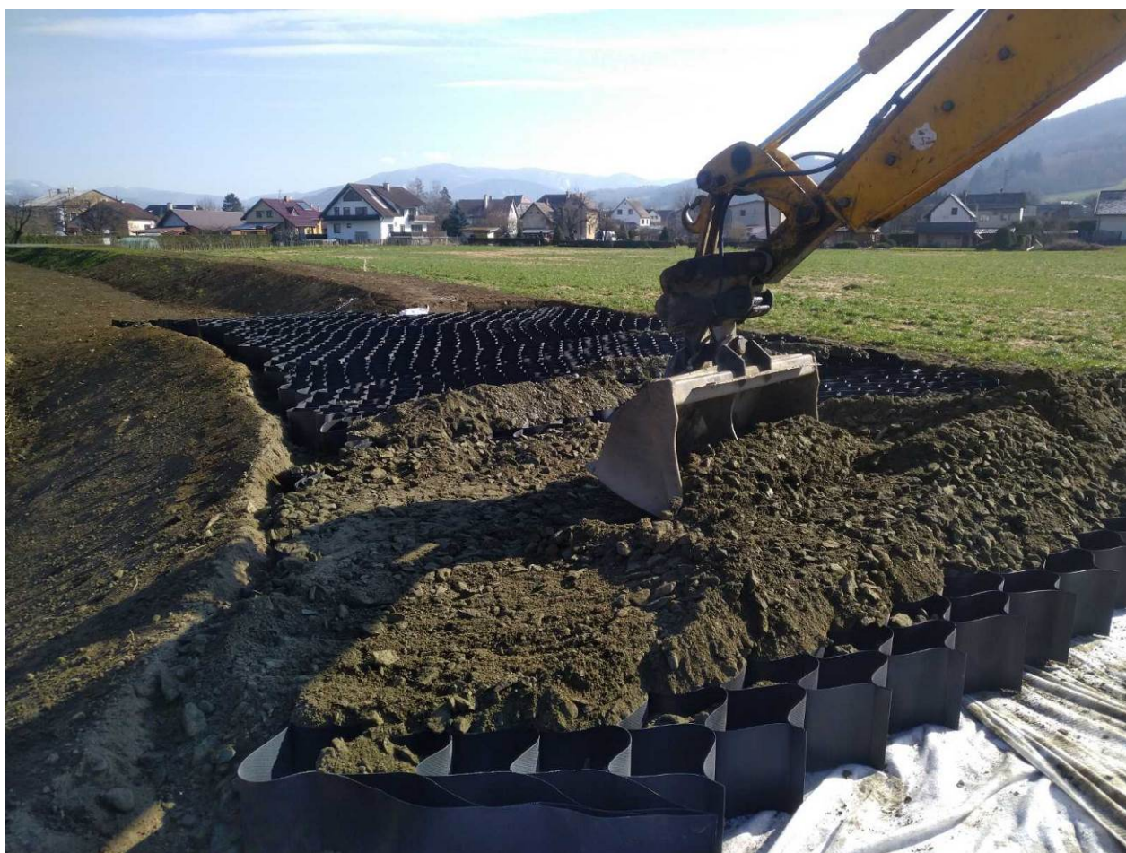
Obrázek 3: pokládka geobuněk na SO07