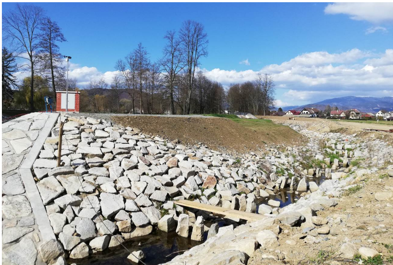
Obrázek 1: finální úpravy rybochodu SO10.1