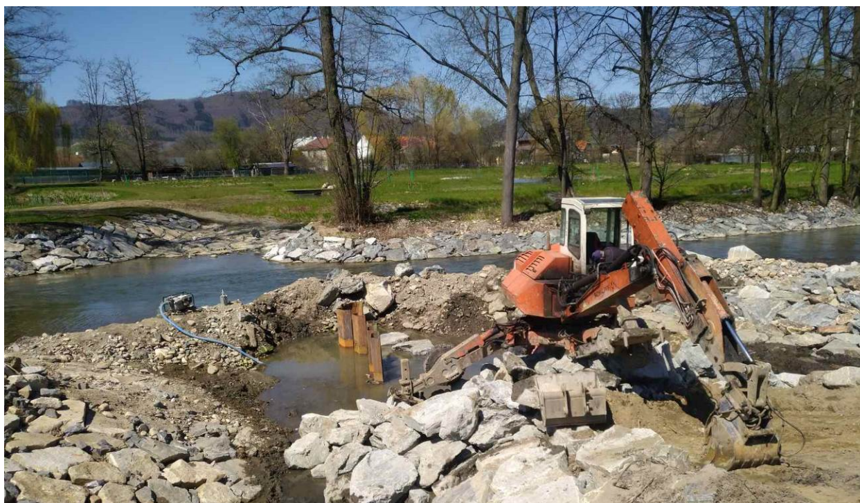
Obrázek 2: úprava nátoku do rybochodu SO10.1