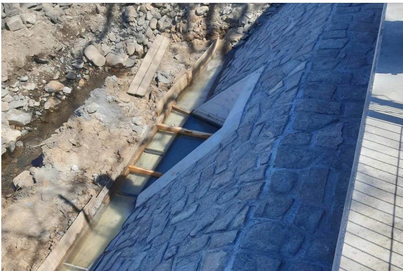
Obrázek 6: kamenný obklad výústního objektu na SO38.3